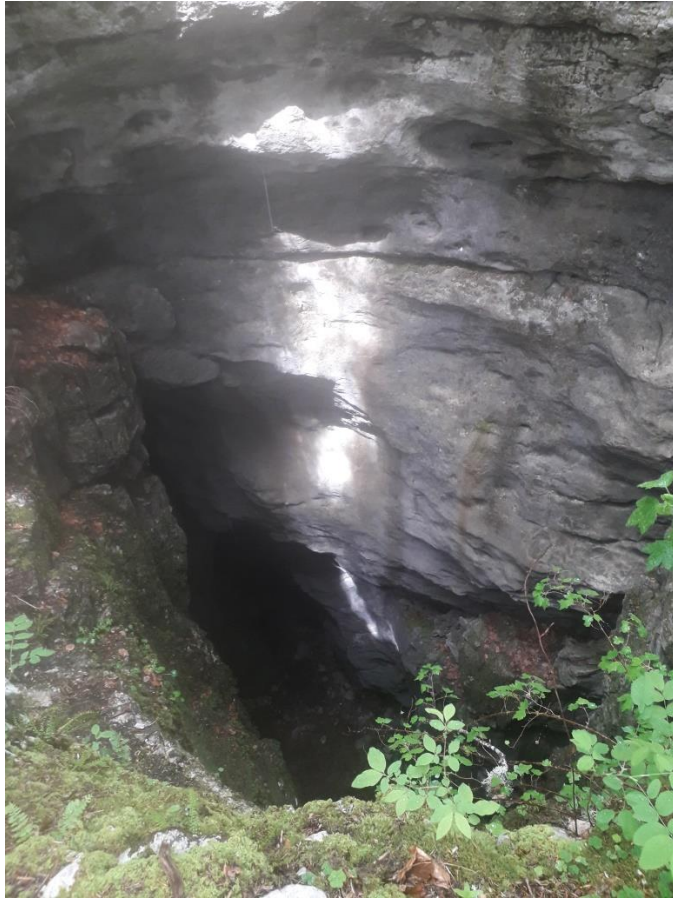
Scialet du Pot du Loup

Au cours de ces sorties, nous n'avons constaté aucun encombrement, même s'il y a beaucoup de randonneurs et promeneurs, sans oublier les campeurs .....tout le monde a besoin de nature, de liberté. Certains en oublient même de se renseigner sur les temps et distances, ou de lire une carte....le déconfinement les pousse dehors avec une certaine insouciance.